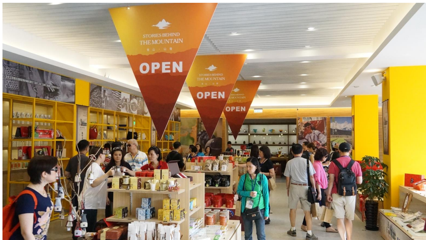
「後山。金選」選物專區銷售推廣